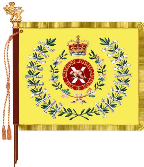
DRAPEAU CONSACRÉ RÉGIMENTAIRE